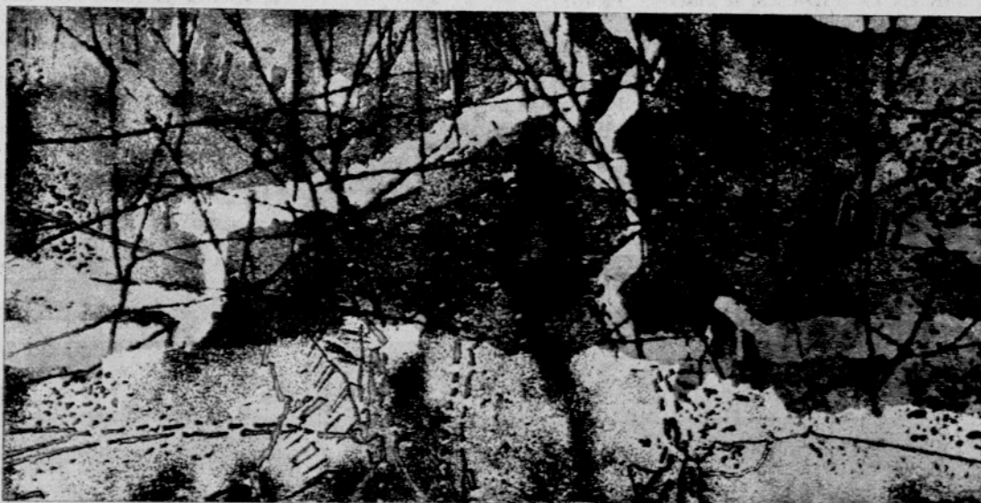
Vila Casas. - Planimetria n.º 1