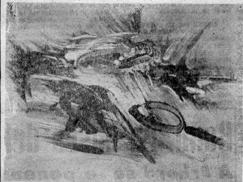
J. J. THARRATS «Le Buisson Ardent»