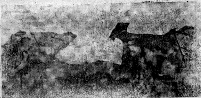
Planimetría, por VILA CASAS

Presentada por «O Figura», esta exposición de grafismos reúne dibujos, maculaturas «collages», estucos, grabados y cerámicas de Claret, Tharrats y Vilacasas. Estos tres pintores, cuyo interés centra desde hace años el arte no figurativo de la menos joven escuela barcelonesa de pintura, nos ofrecen no una nueva posición en su actitud, sino el proceso de ese redescubrimiento que es siempre la pintura que huye de todo estancamiento e invalidez. Las obras simplistas de Claret, en las que la línea desempeña una función ordenadora y de equilibrio, ciñen de pronto, en una especie de arabesco geométrico, zonas de color con una interdependencia de esas otras zonas blancas en las que la línea, el grafismo, señala una ausencia de color. En este mundo de recintos informes parece encerrarse un misterioso teorema no euclideo. Tharrats ha buscado también en el color una magia libre y desceñida. La suya es la pintura de un mundo de formas a punto de cristalizar, pendientes de esa ley que sólo él sabe y que un día, de la noche a la mañana, a través de esta pura creación, establecerá una poética colorística nueva, que ya, no obstante, recogió en otro tiempo y devuelve ahora a un nuevo cosmos: al de su «Homenaje a Velázquez, por ejemplo.