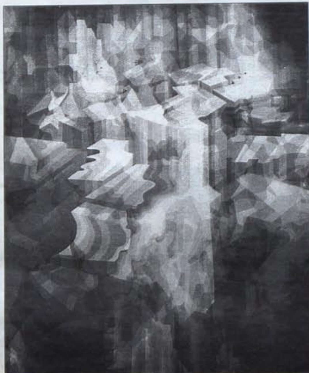
1712D. Obra de Joan Claret.

Con diversidad de perspectivas el pintor nos explica la cueva, repleta de ruinas que simbolizan las antiguas civilizaciones, donde se protege la humanidad. Tememos a la luz, pero la misma se impone a la oscuridad y, sumidos en sombras, advertimos que la unidad de las potencias de la mente es la fuerza que explica nuestra permanencia en el mundo. Joan Claret no se dispersa, sino que se concentra para hallar una apasionante variedad de matices que justifican plenamente el interés de su obra. Recomiendo con insistencia la visita.