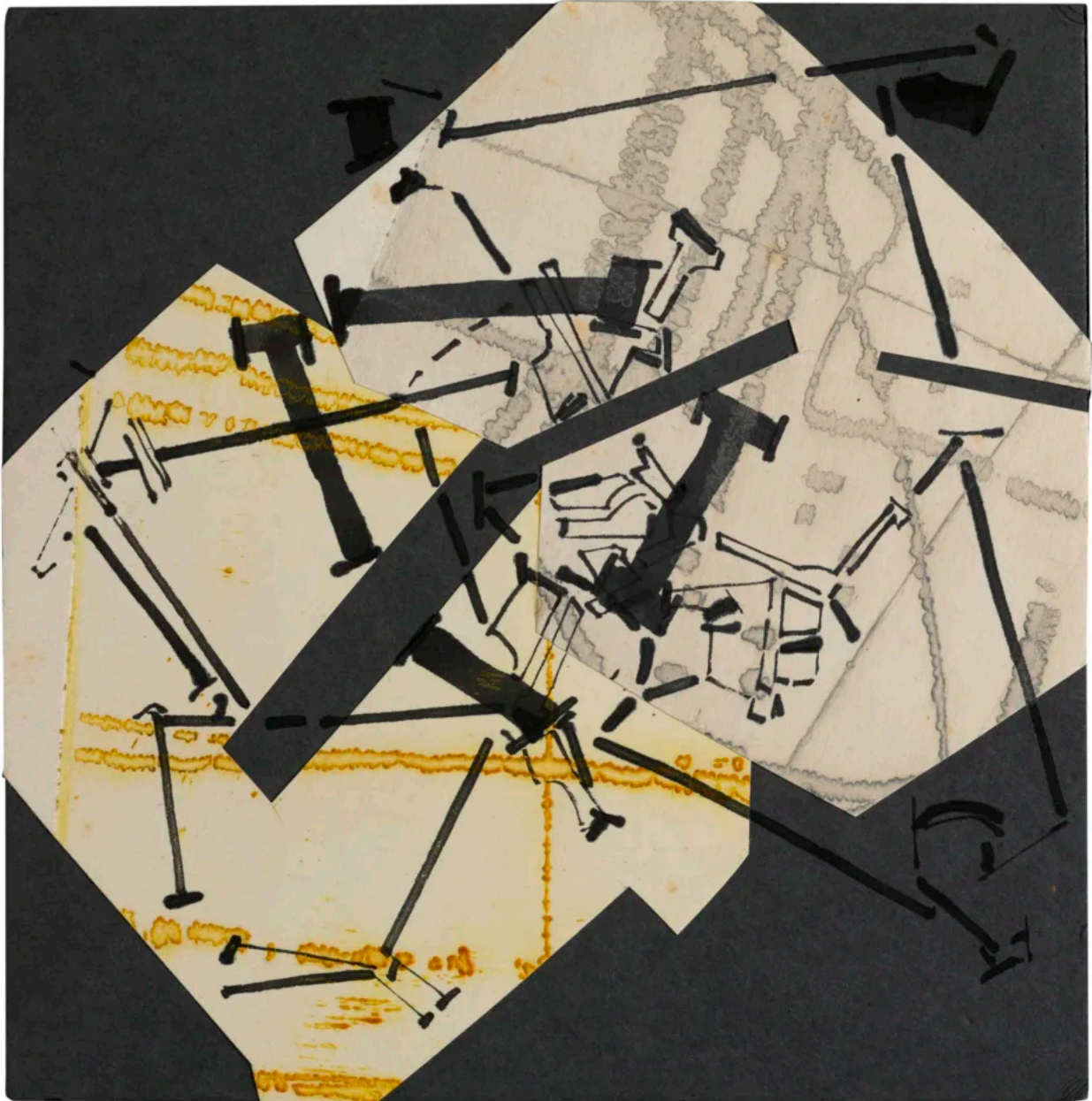
Obra de Joan Vilacasa "Planimetria (Felicitació de Nadal) 1974. Collage sobre cartró. Donació de la Col·lecció Brigitte i Hans Robert Thomas.

L'exposició s'inicia en un espai purament introductori i ens desvela diversos interrogants com ara qui era la família Thomas, on es va originar aquesta amistat i per què aquesta col·lecció va arribar a Barcelona. A més, suscita el diàleg entre l'obra dels dos artistes catalans que, malgrat tenir trajectòries independents i genuïnament personals, tenien un gran lligam de fons.