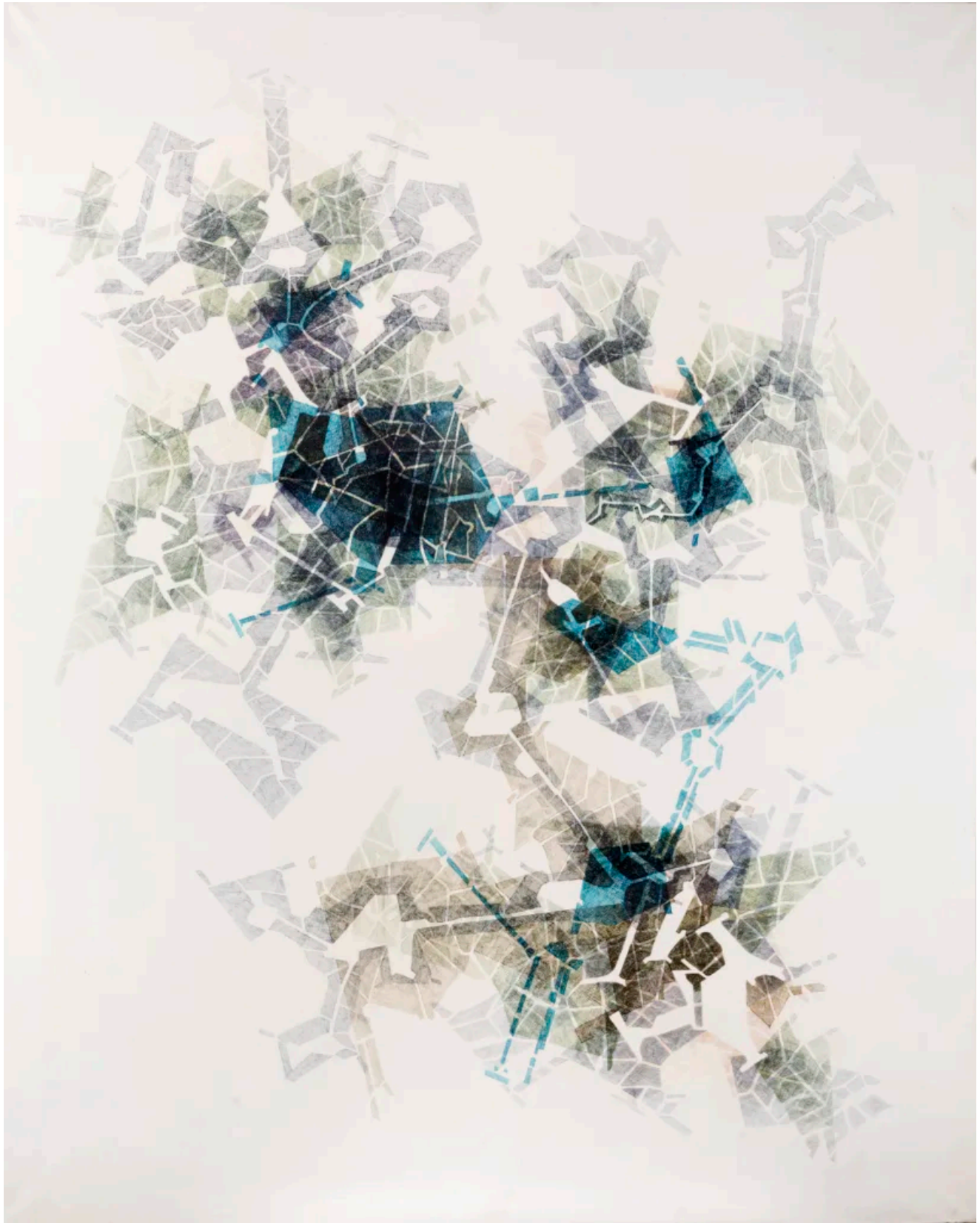
Obra de Joan Vilacasa "Planimetria 69/65" 1969. Donació de la Col·lecció Brigitte i Hans Robert Thomas.